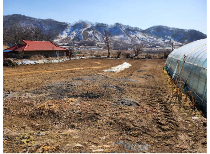
기호 1 전경