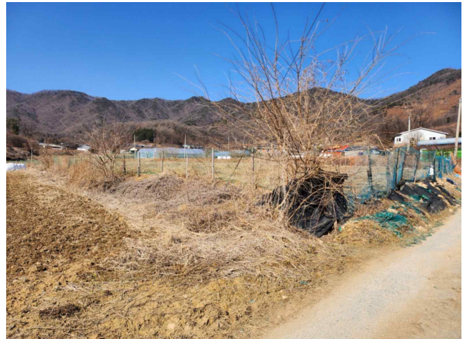
기호 2 전경