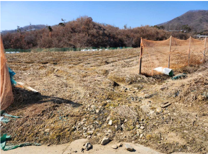
기호 2 전경