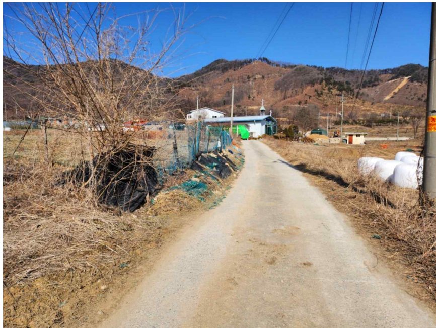
기호 2(동남측 도로)