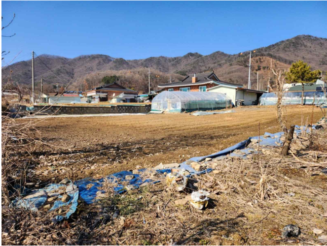
기호 1 전경