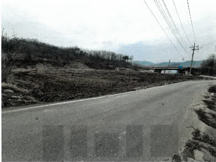
본건 남동측에서 촬영