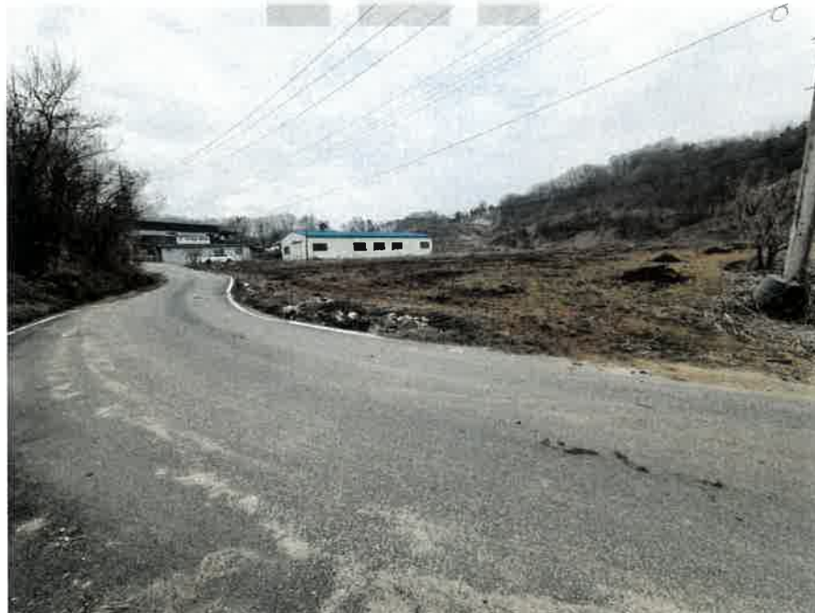
본건 북동측에서 촬영