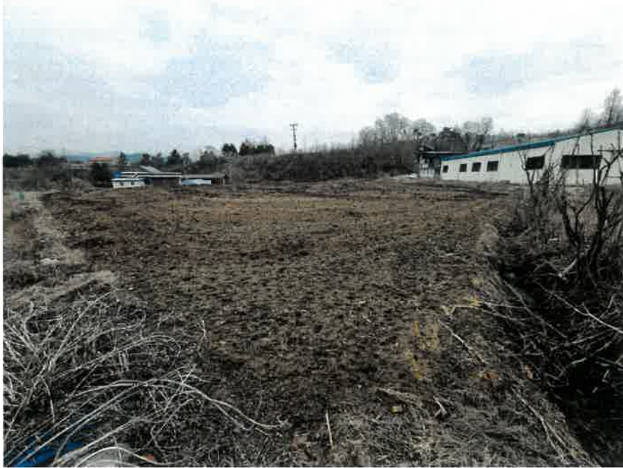
본건 남서측에서 촬영