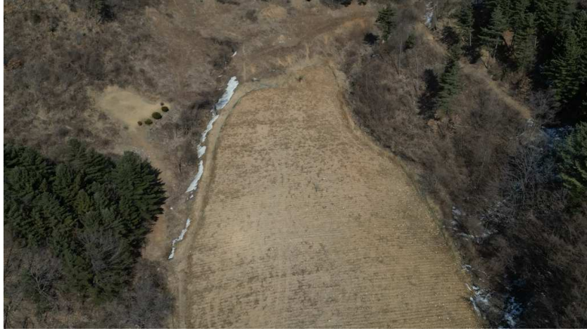
본건 남서측 전경