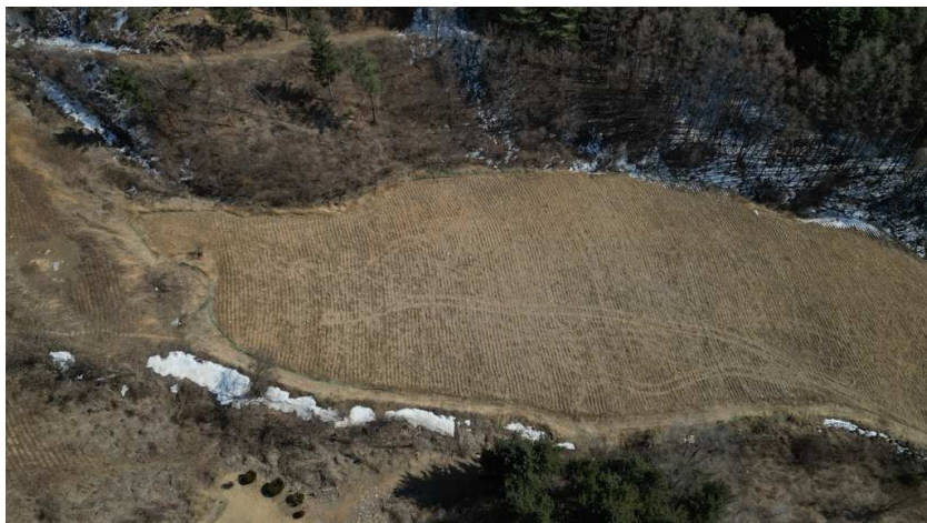
본건 북서측 전경