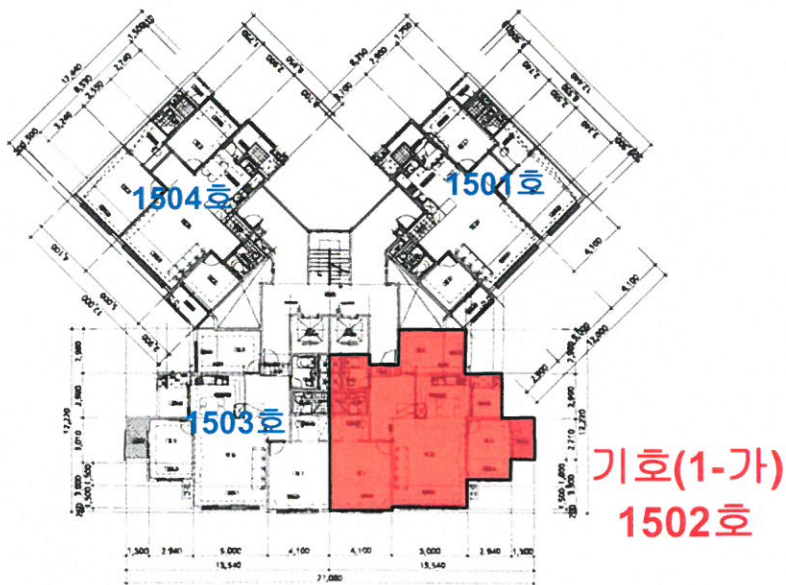
[ 기호(1-가) 대주피오레2차아파트 제204동 제15층 ]

소재지 충청북도 청주시 흥덕구 비하동 367 대주피오레2차아파트 제204동 제15층 제1502호