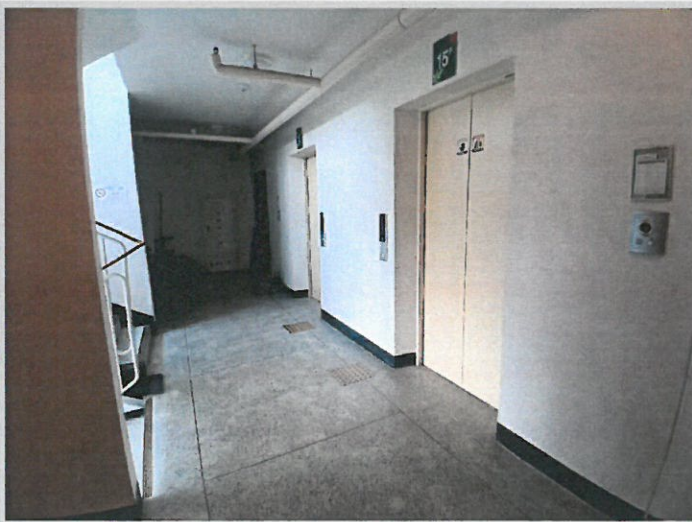
[본건 내부승강기 및 복도]