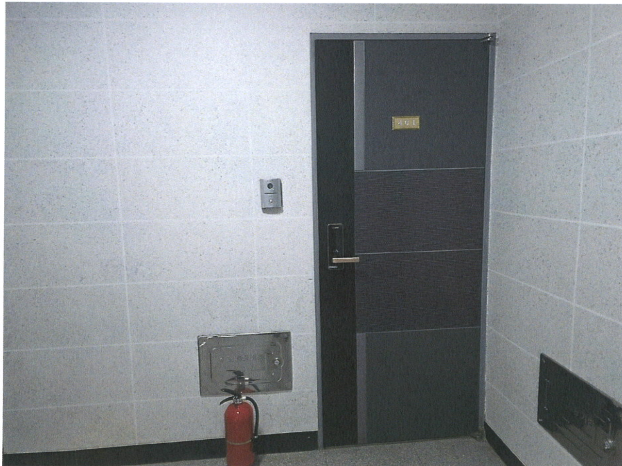
본건 현관 전경