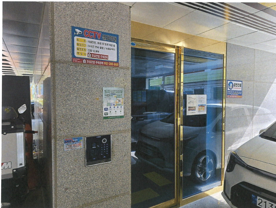
본건동 주출입구 전경