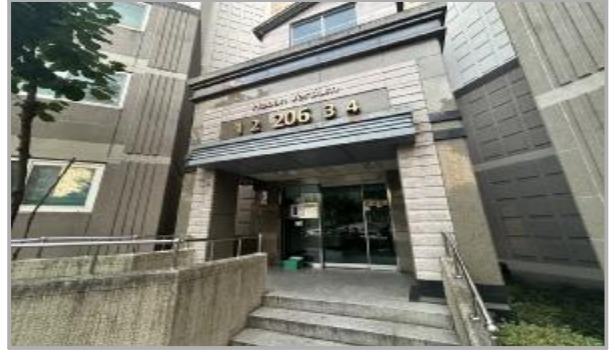
본건 출입구 전경