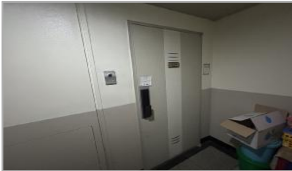
본건 호 전경