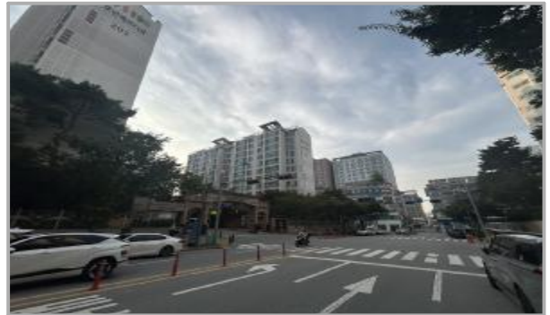
본건 주위 전경