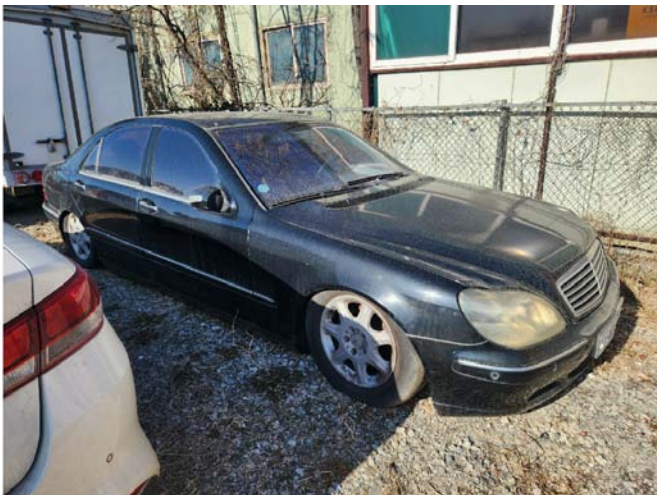
(4) ( )