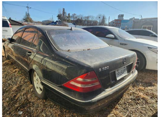
(4) ( )