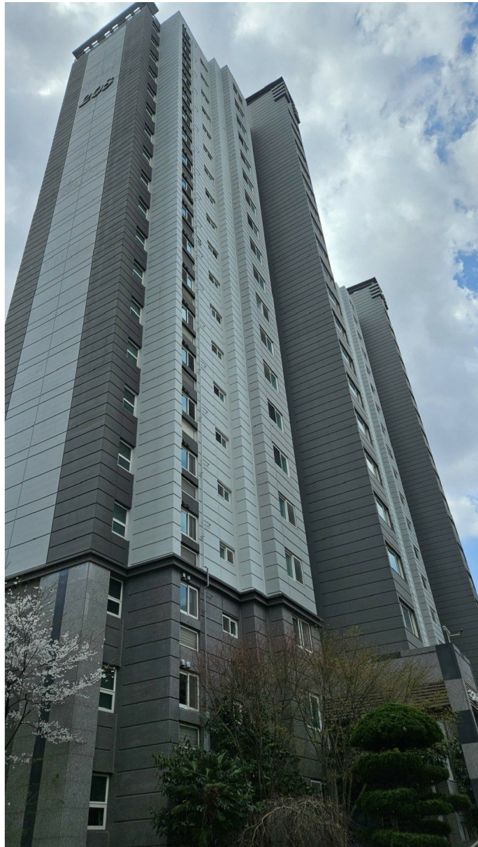
[ -- ]