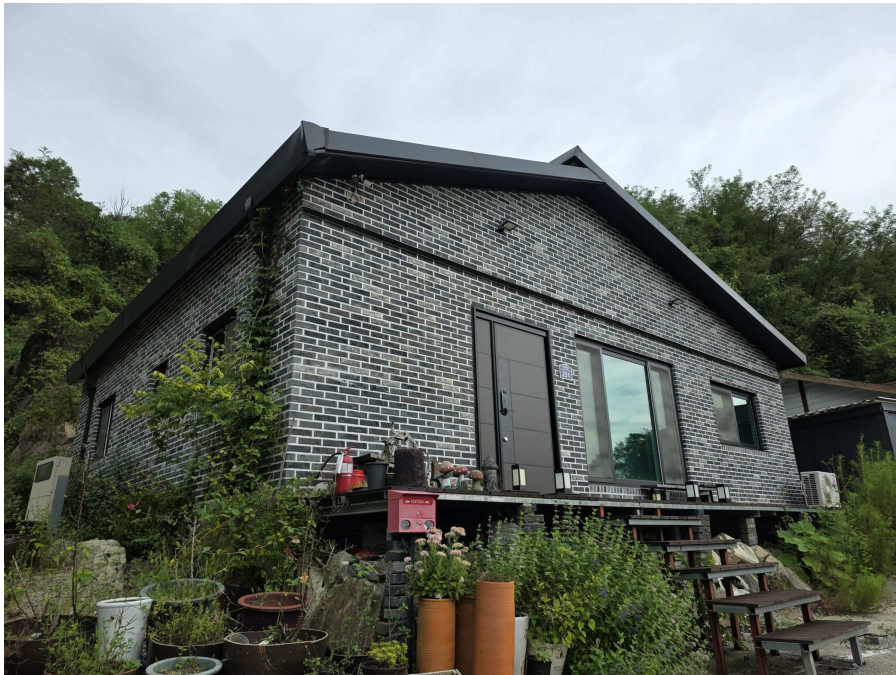
일련번호 2 전경