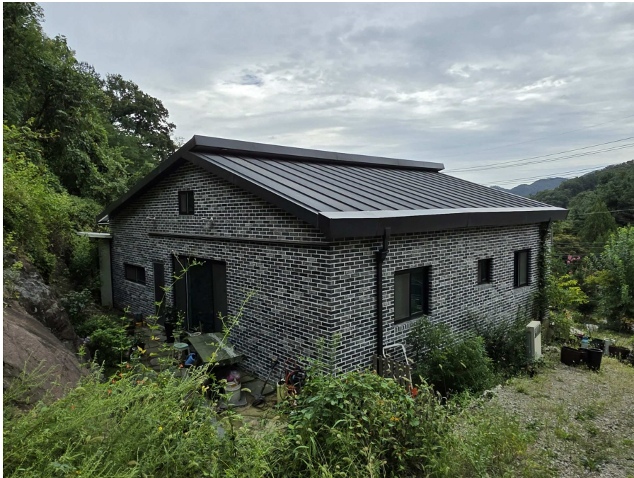
일련번호 2 전경