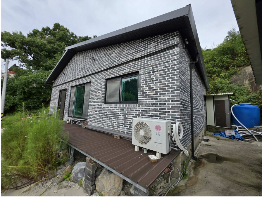
일련번호 2 전경