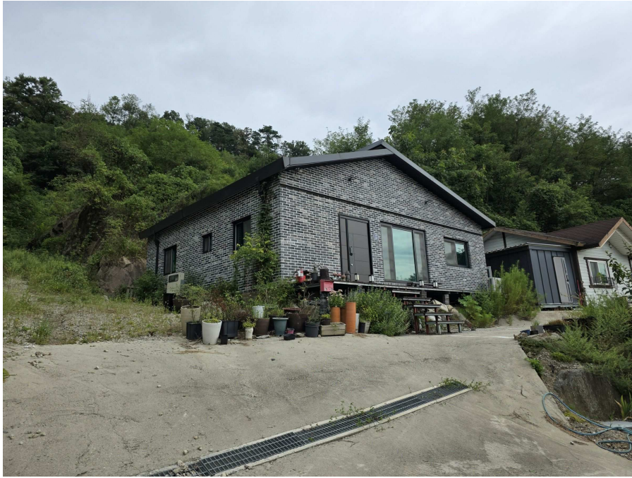
일련번호 1 전경