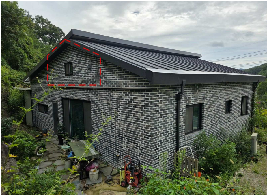
일련번호 2 다락부분(건물포함 감정평가)