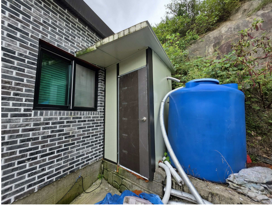
제시외 건물 ㄱ) 전경