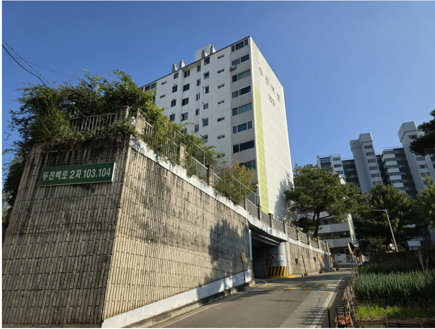
본건 아파트단지 전경