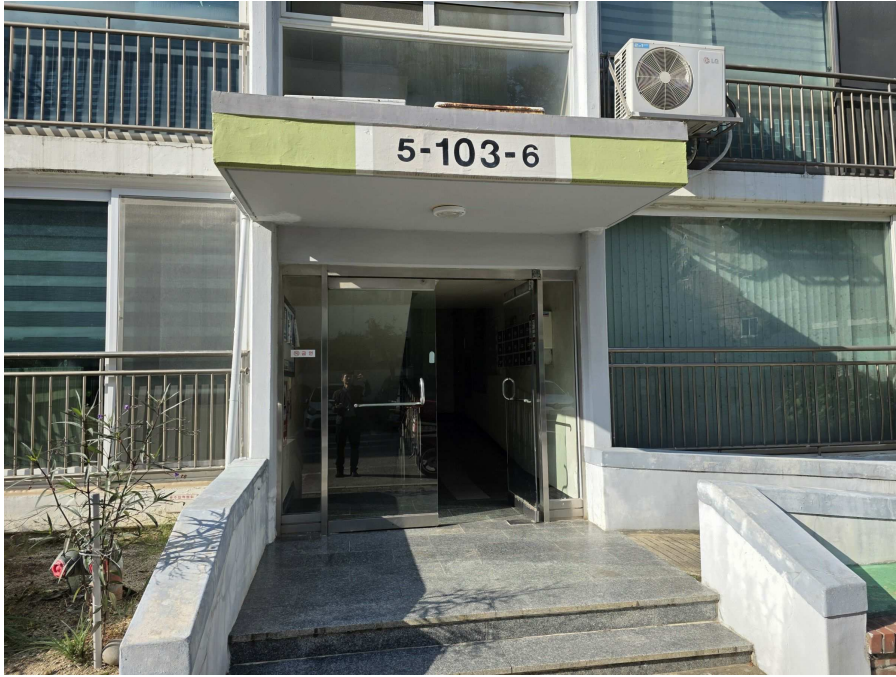
1층 공동출입구 전경