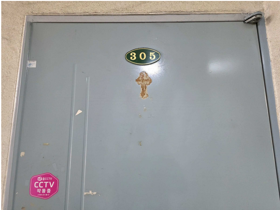
본건 현관문 전경