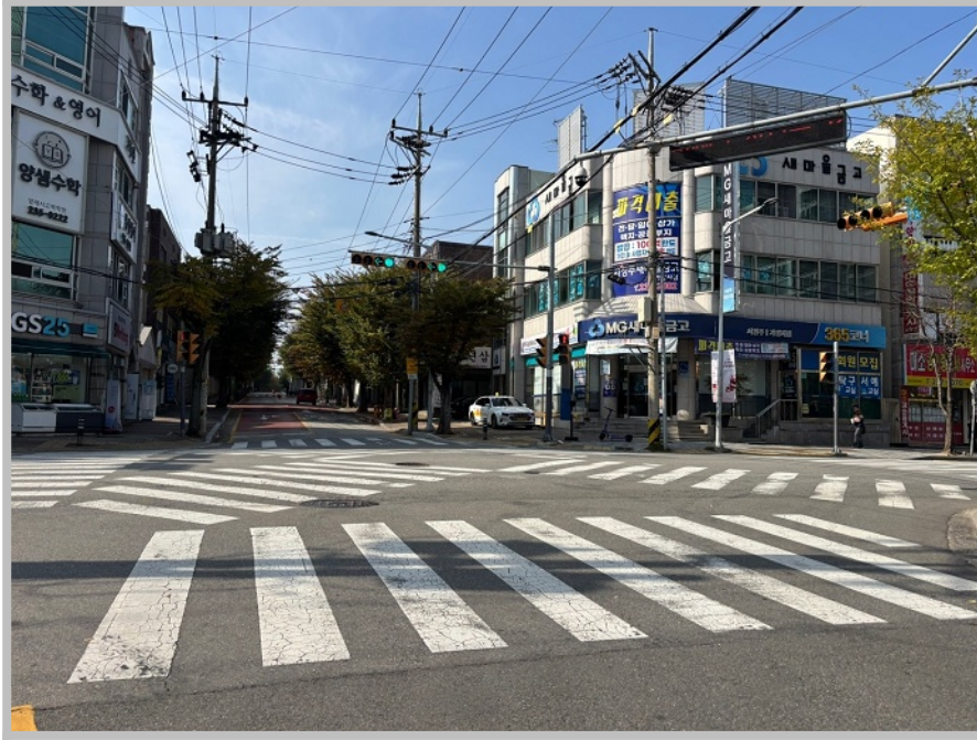
【 본건 북서측 주위환경 】