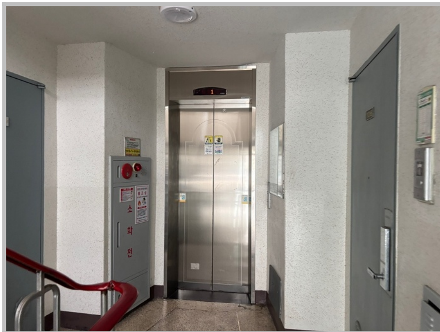
【 본건 승강기 설비 전경 】