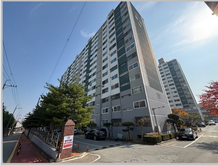
【 본건 소재 건물 외부전경 】