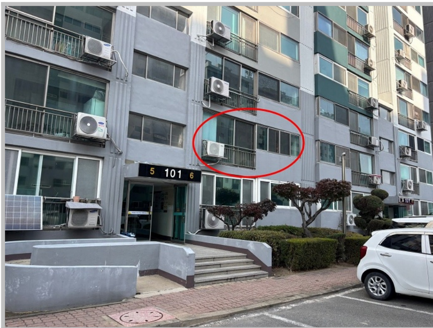
【 본건 외부 전경 및 주출입구 전경 】