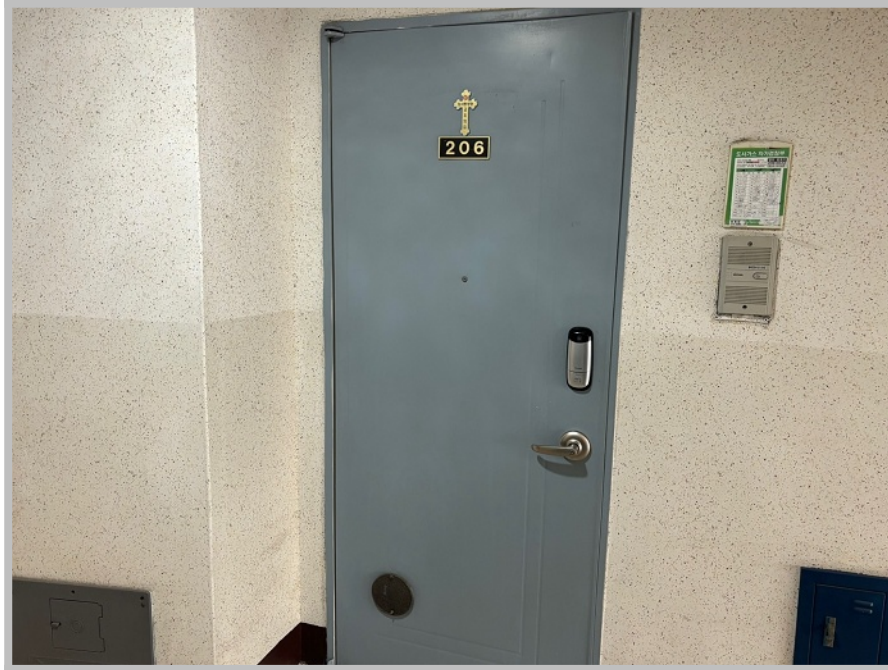
【 본건 전경 】