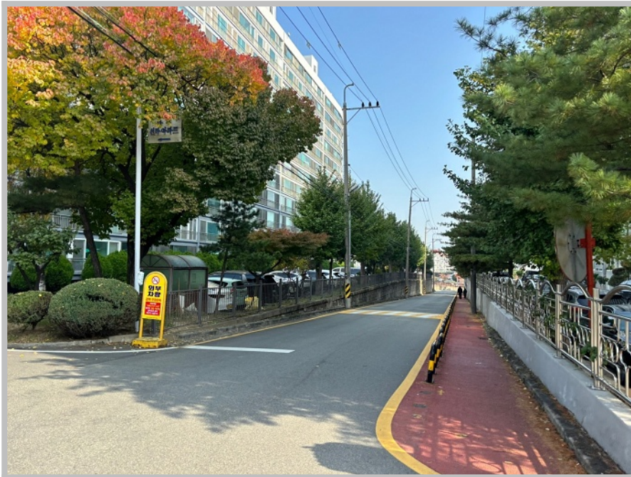
【 본건 북측 주위환경 】