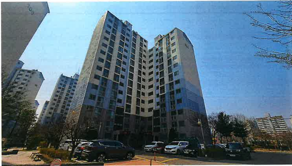
본건 동 전경_1