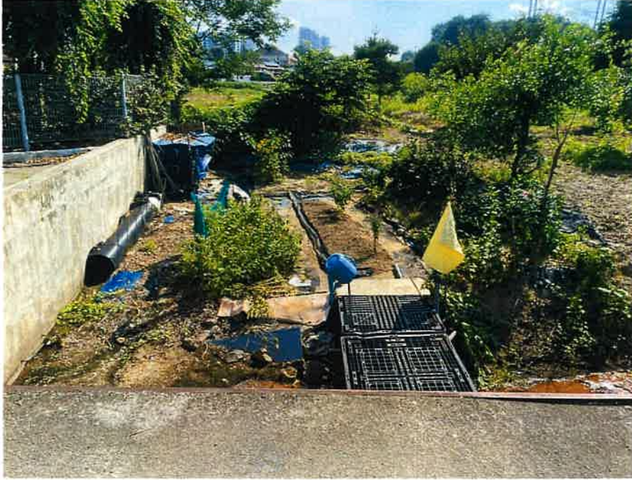
본건 전경(서측에서 촬영)