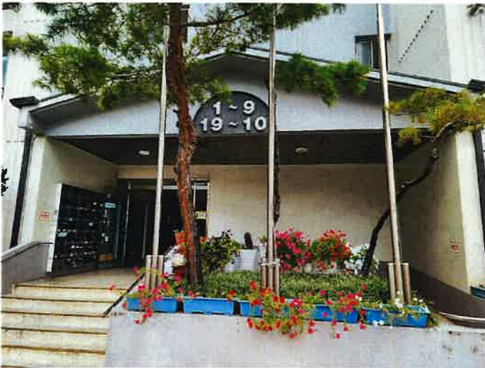
아파트 1층 출입로