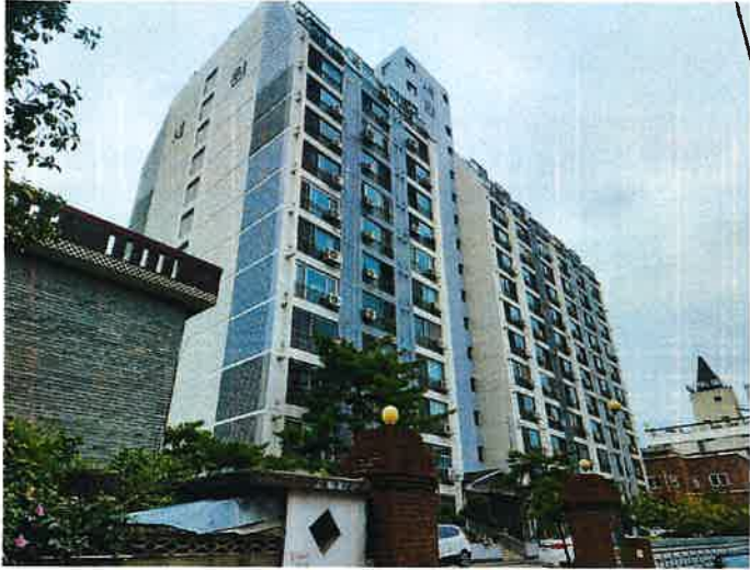
본 아파트 전경