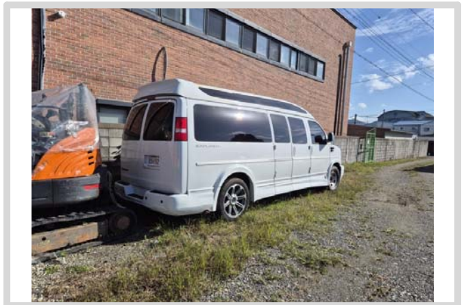
【본건 우측 측면】