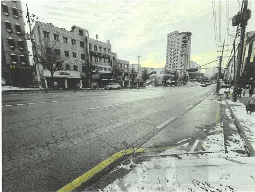
본건 인접도로 및 주위환경