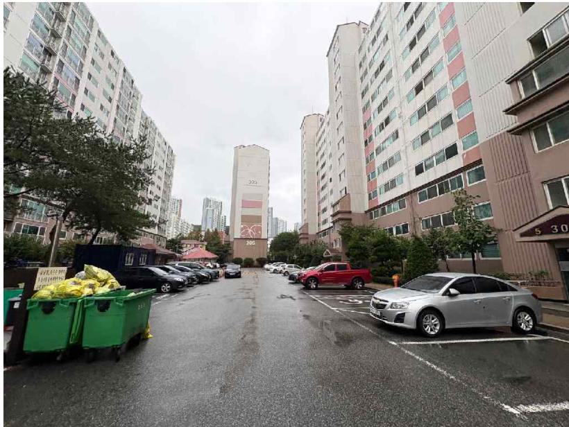
본건 단지 전경