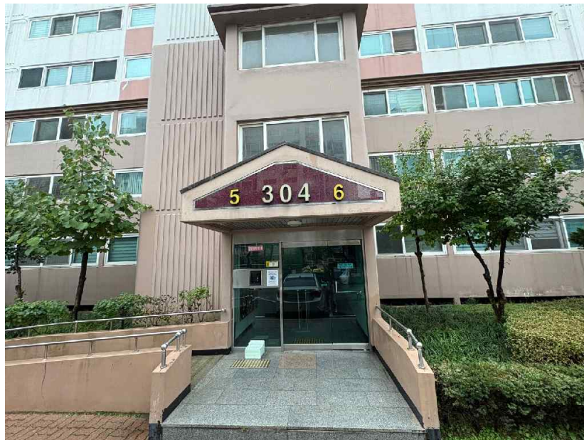
본건 건물 입구