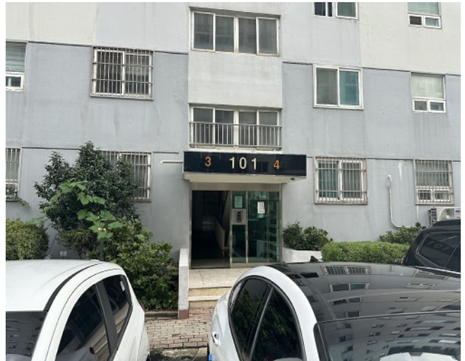
[본건 1층 출입구]