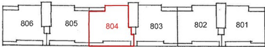
[ 호 별 배 치 도 ]