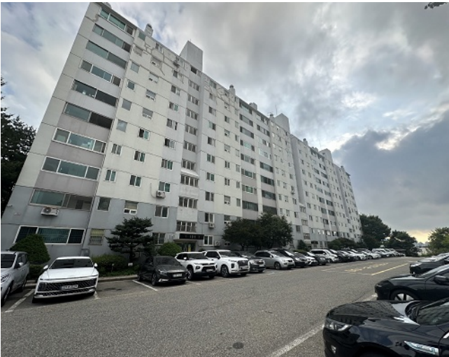
[본건 동 전경]