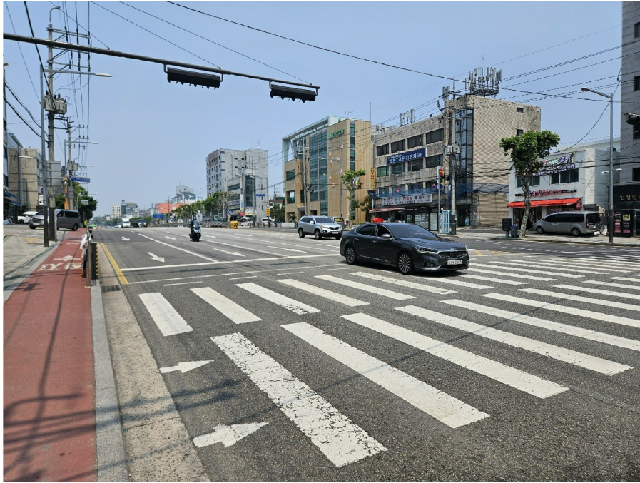
< 1 >