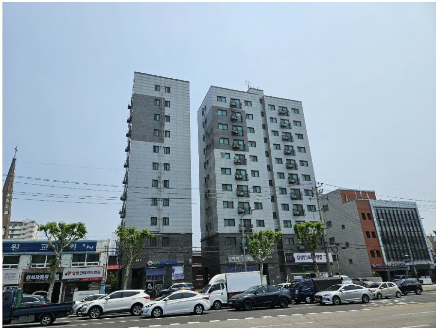
< 2 >