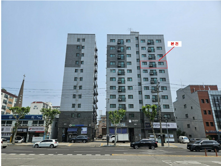
< 1 >