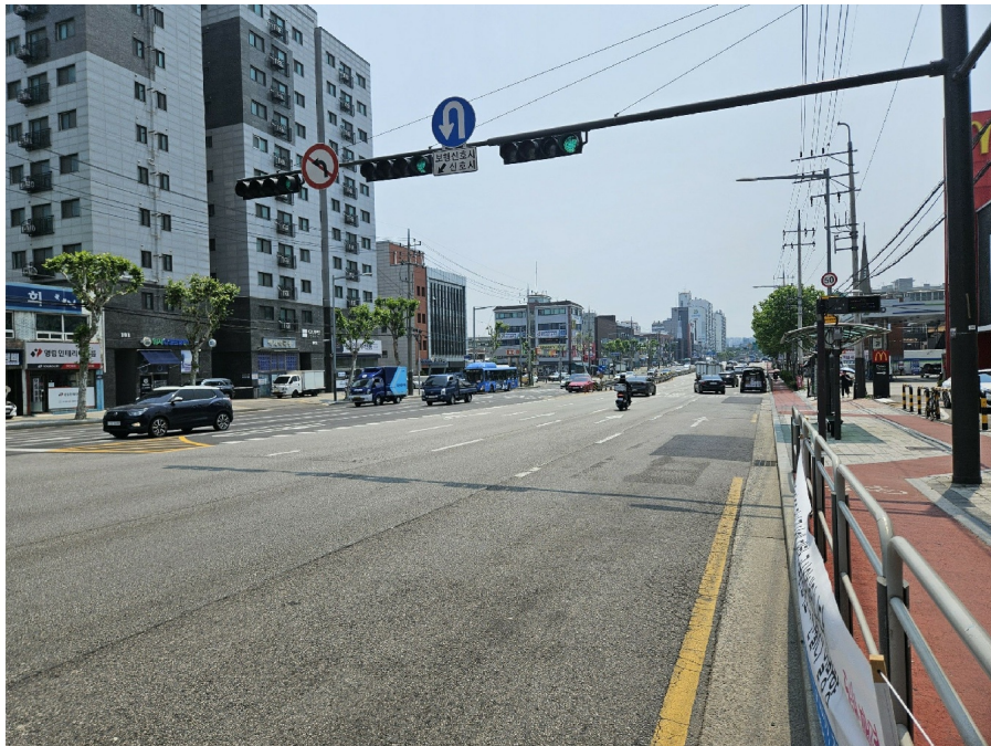
< 2 >