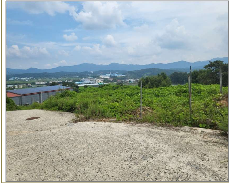
본건1), 3) 전경