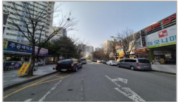
본건 주위 전경