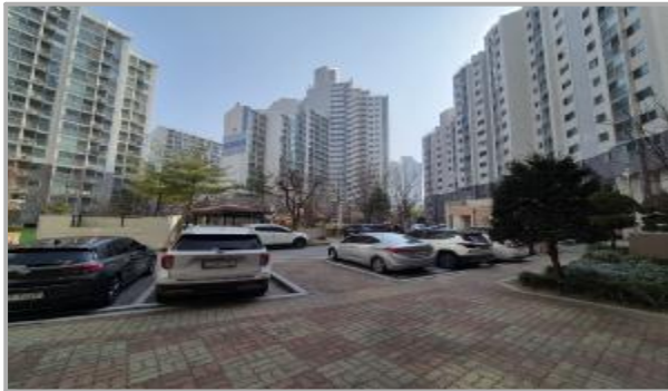
본건 단지 전경