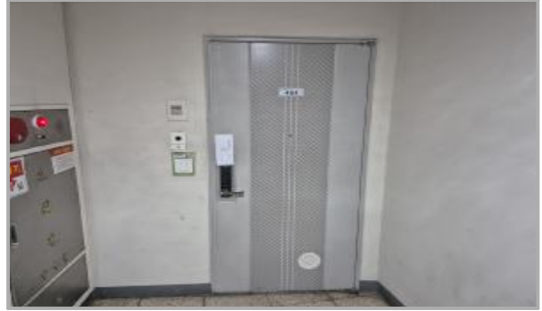
본건 호 전경