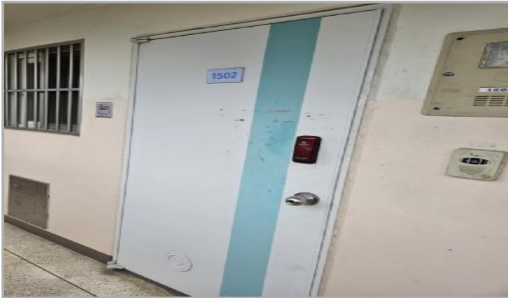
본건 호 전경