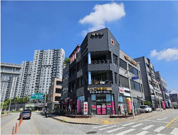
【본건 건물 전경】