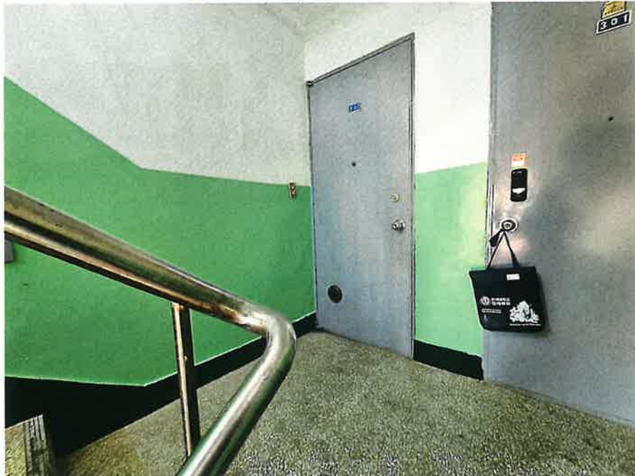
본건 현관 전경