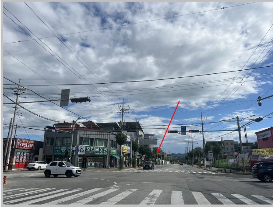
【 본건 북측 전경 및 주위환경 】