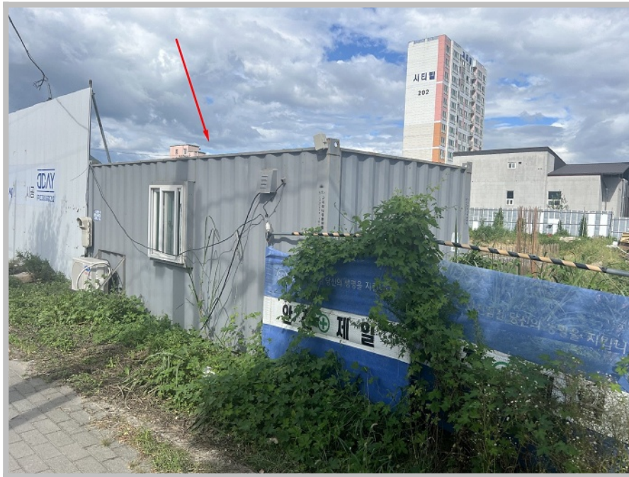
【 제시외컨테이너 ㉠ 】