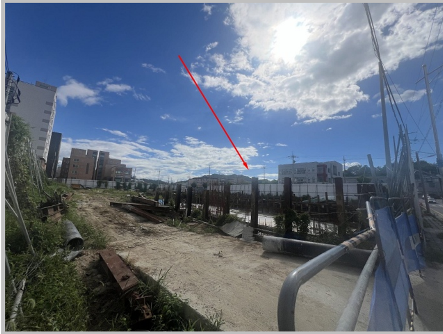
【 본건 북동측 전경 및 제시외건물 ㉠ 】