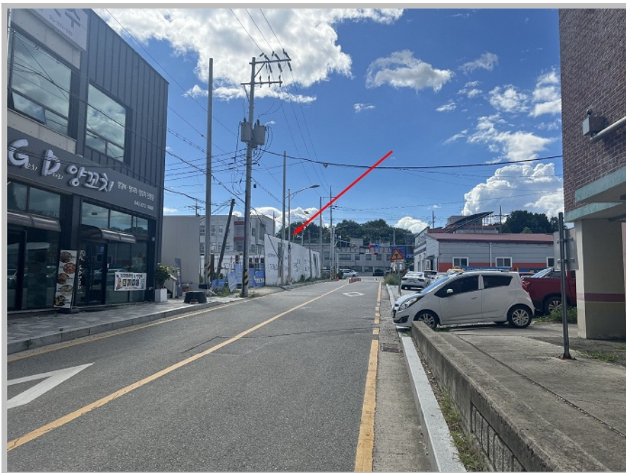
【 본건 북동측 전경 및 주위환경 】