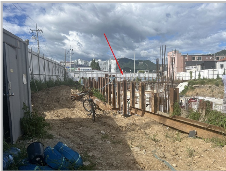
【 본건 남서측 전경 및 제시외건물 ㉡ 】