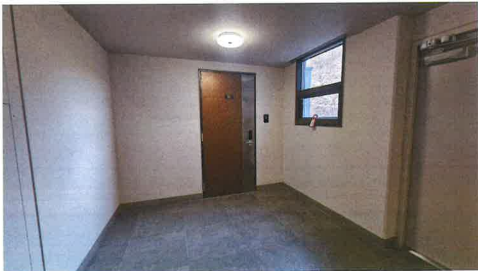
본건 출입구 전경