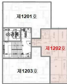
【 호별배치도 】

서울특별시 강서구 화곡동 899-21 양지샤인아파트 제12층 제1202호