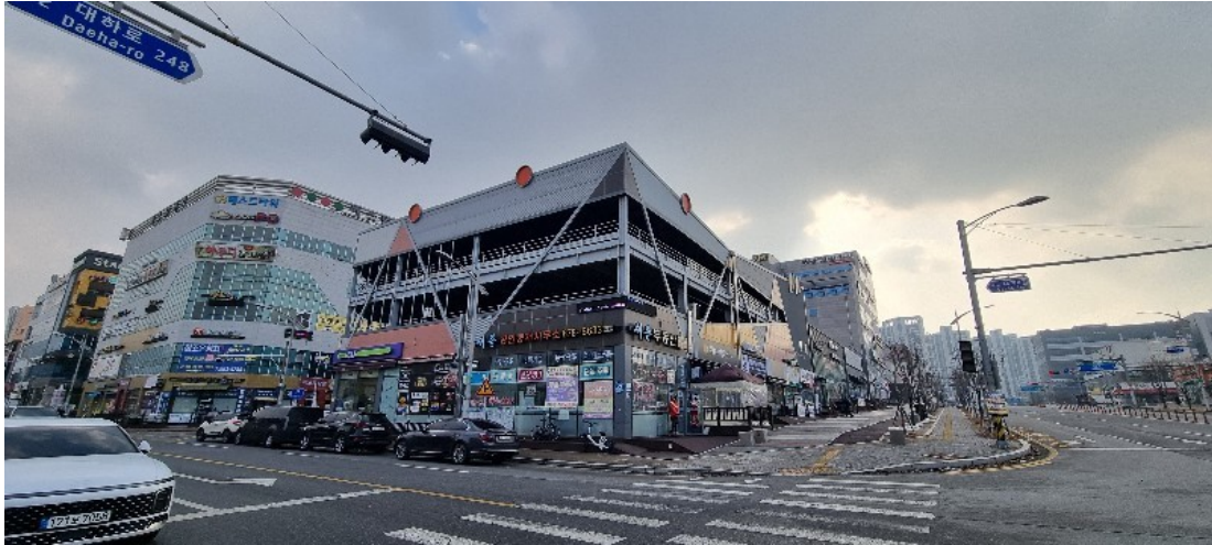
【본건 소재 건물 전경】