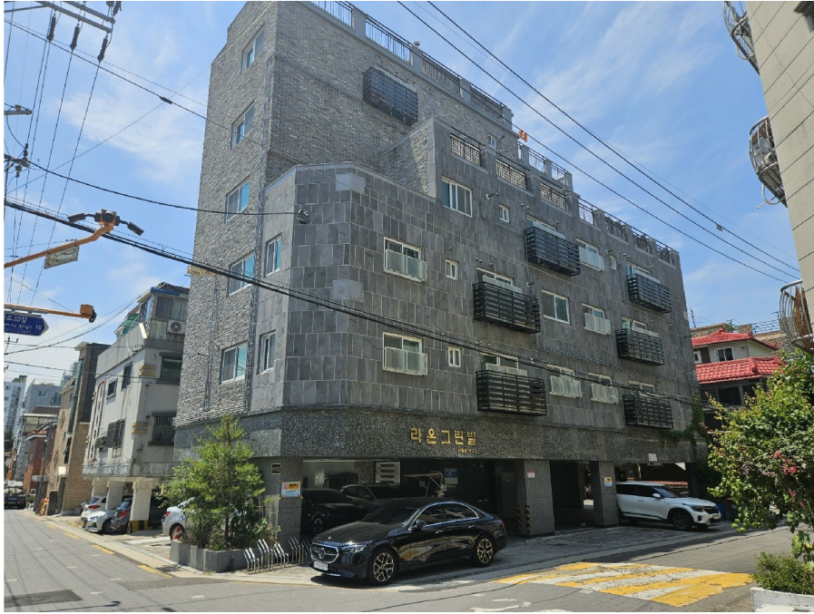
< 1 >