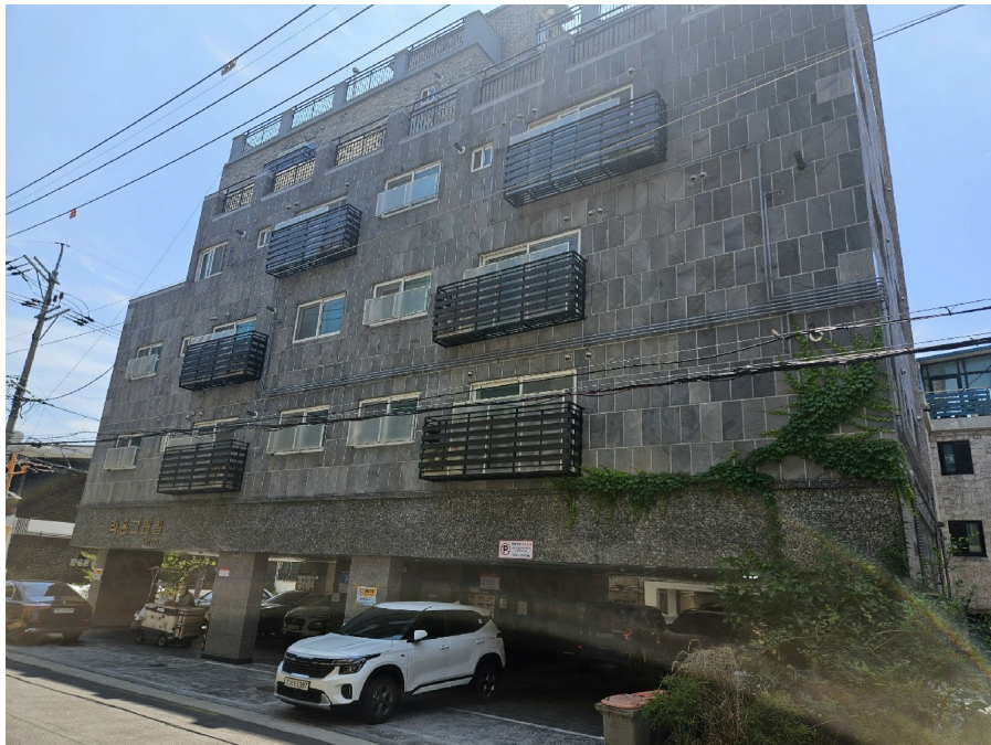
< 2 >