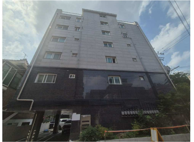
대상물건이 속한 건물의 전경