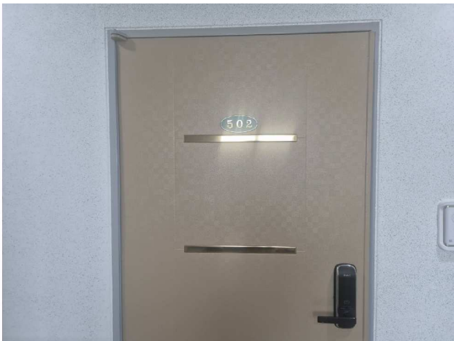
일련번호 1) 출입구 전경