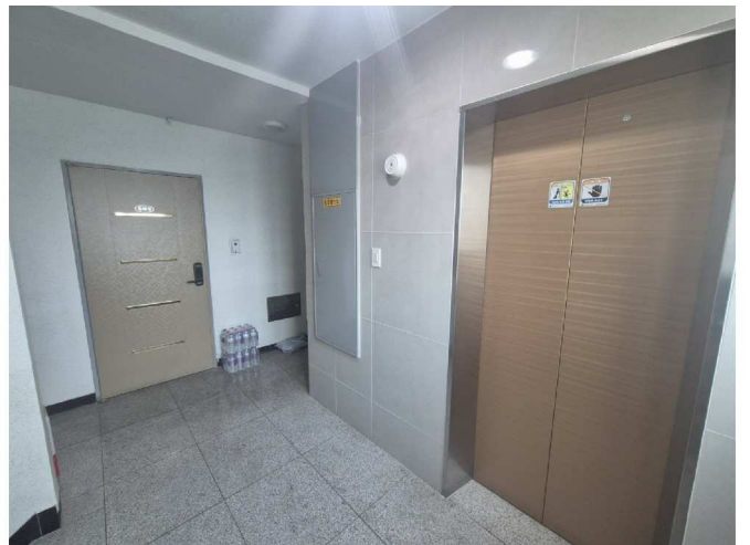
일련번호 1) 출입구 및 복도 전경