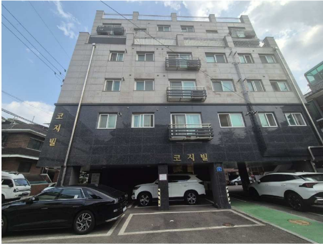
대상물건이 속한 건물의 전경