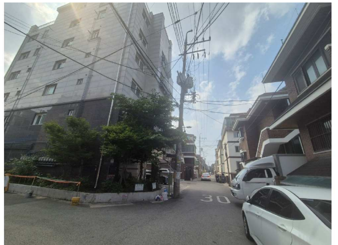
대상물건이 속한 건물의 주위전경