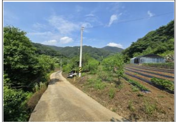
기호 1) 전경