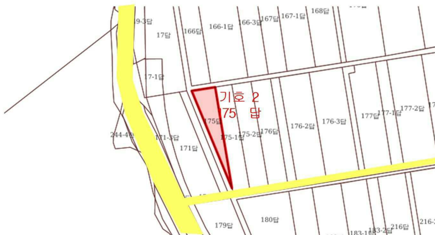
< 기호 2 >