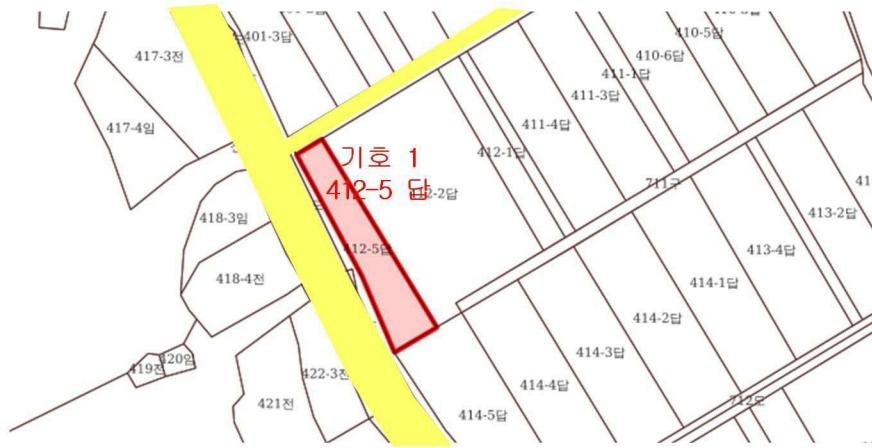
< 기호 1 >