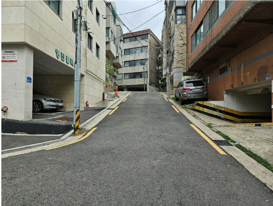
< 1 >