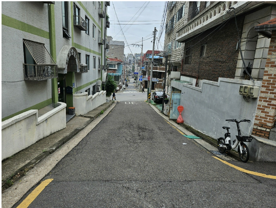
< 2 >