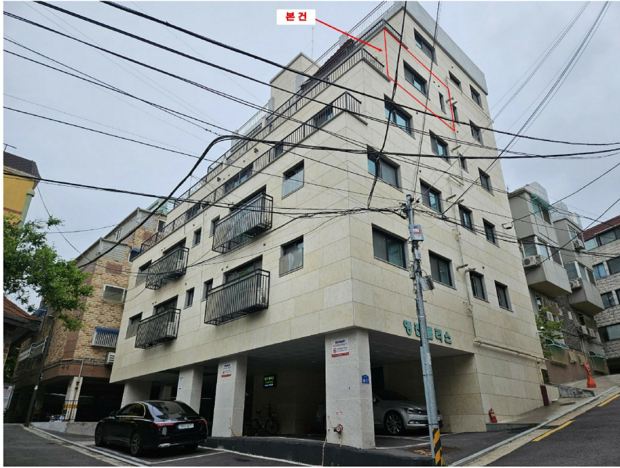
< 1 >