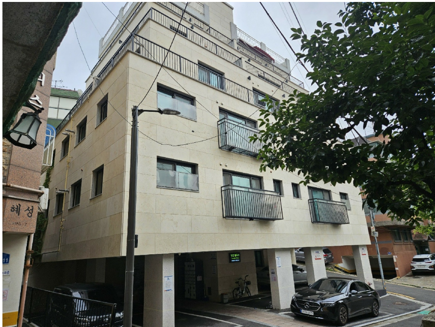
< 2 >