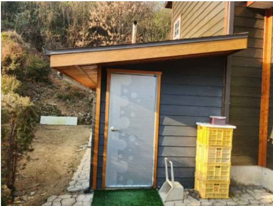
제시외 건물 ㄱ)