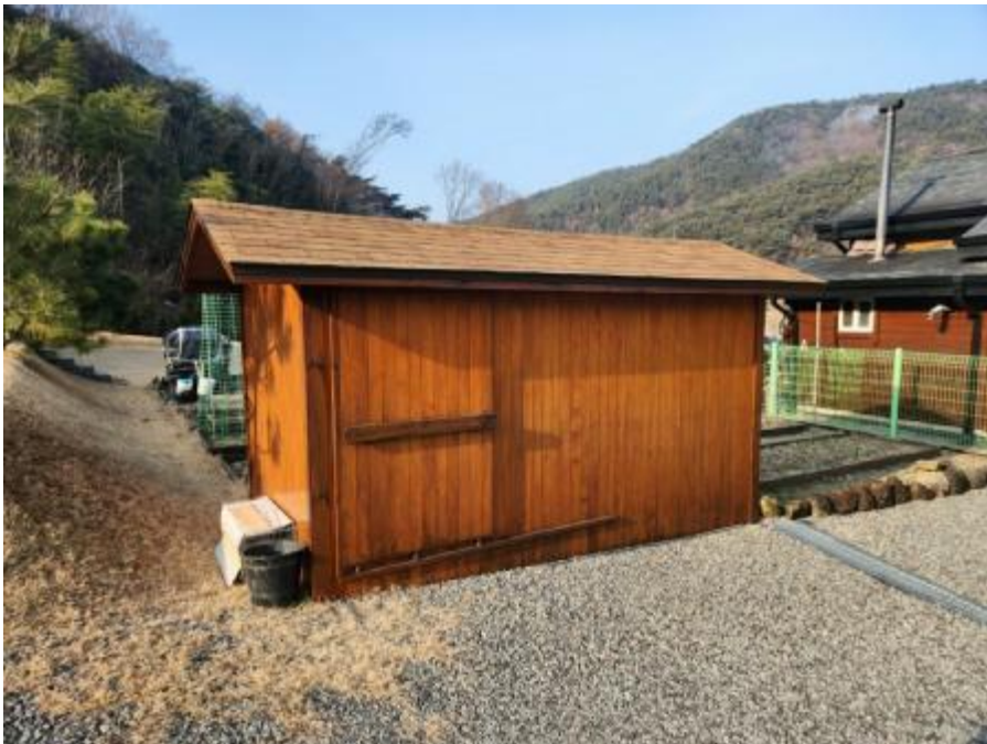
제시외 건물 다)