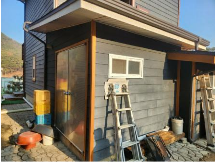
제시외 건물 나)