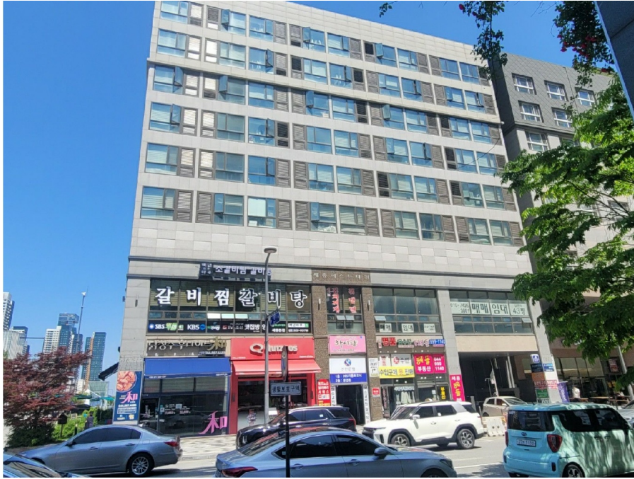
[ ( ) ]