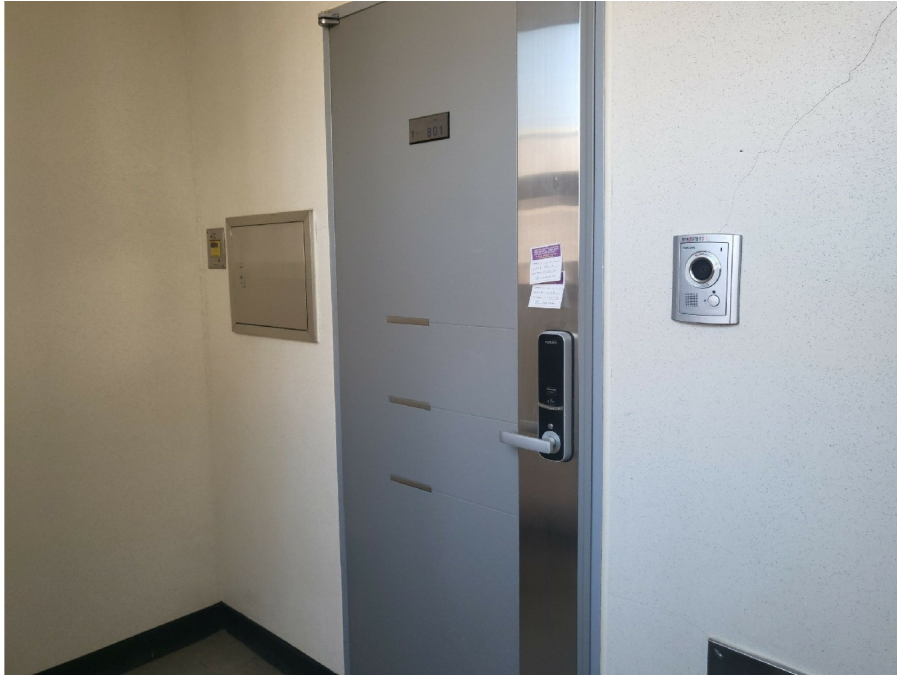
[ ( 8 801 ) ]