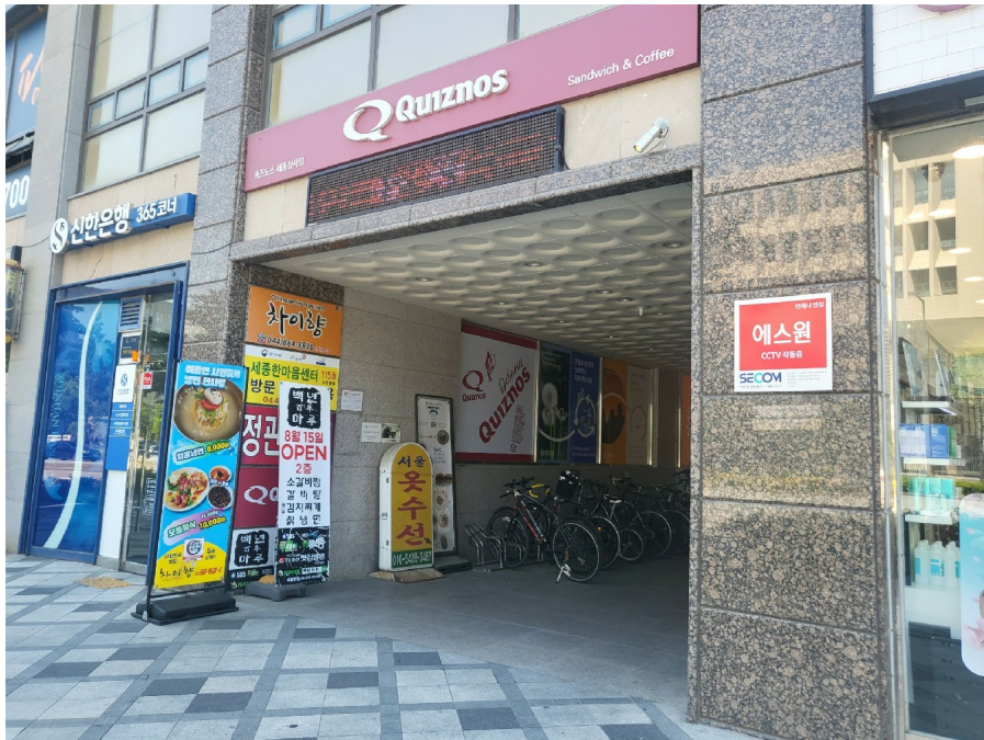
[ 1 ]