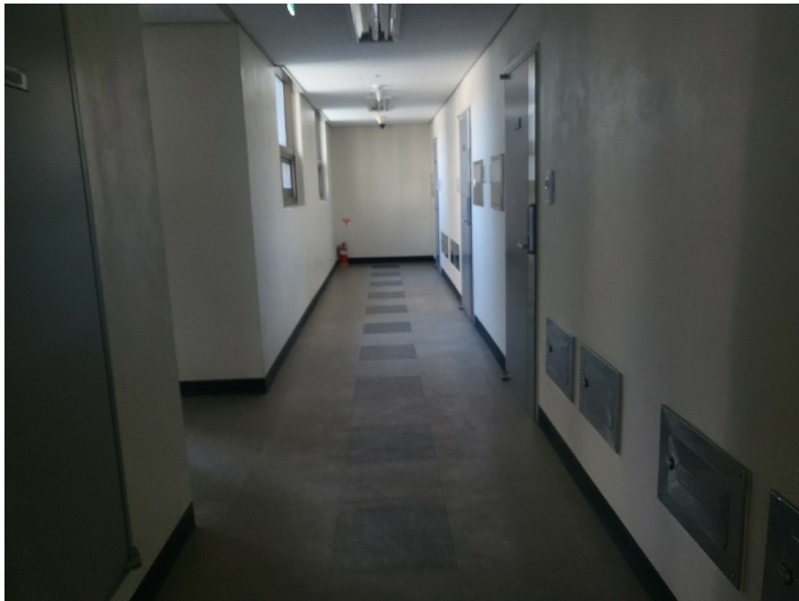
[ 8 ]