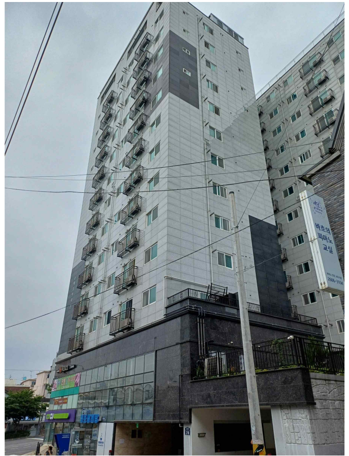
본건 소재 건물 남측 전경