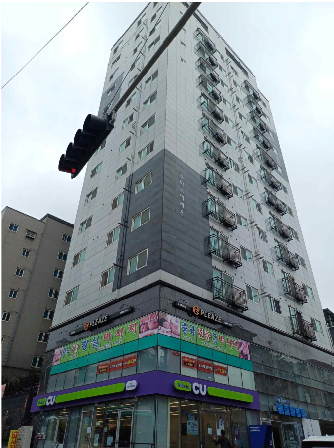
본건 소재 건물 서측 전경