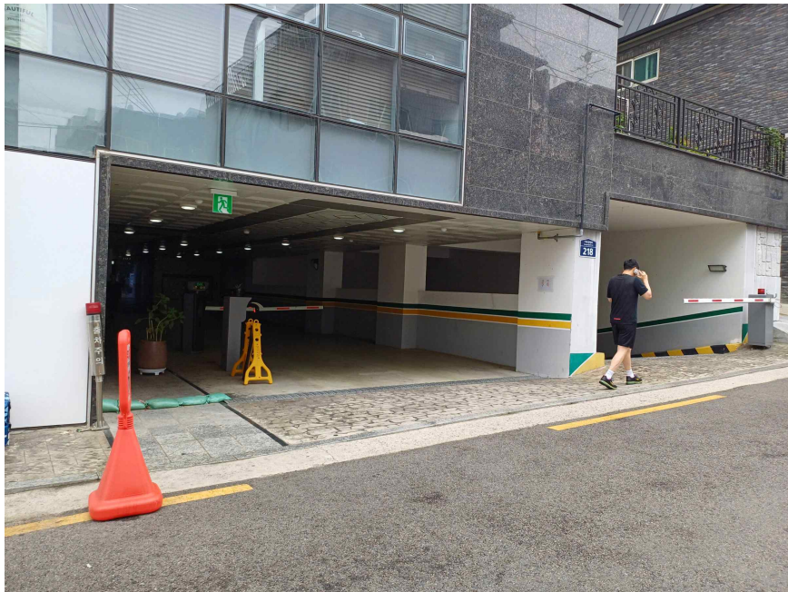
주차장 등 입구