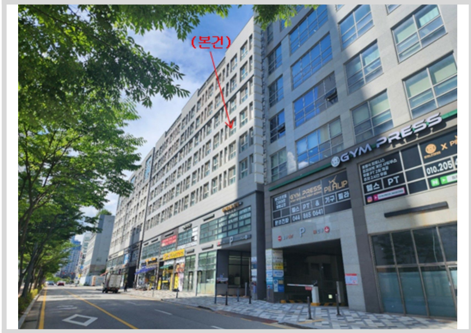
본건 전경 - 본건 남측에서 촬영