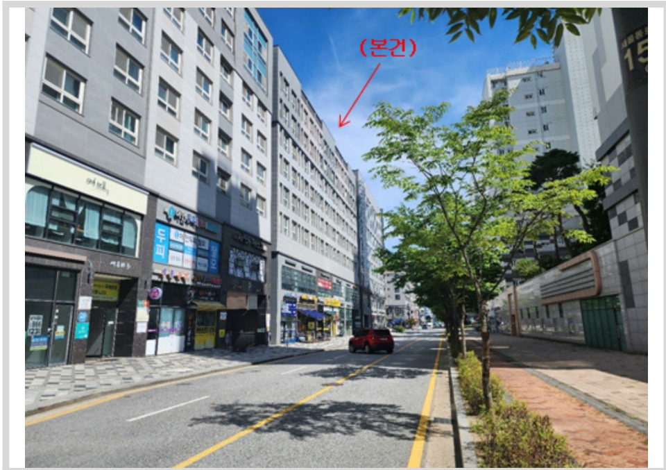
본건 주변 전경 - 본건 북서측 인근에서 촬영