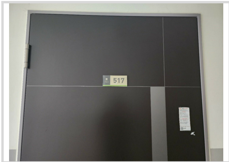
본건 현관문 전경