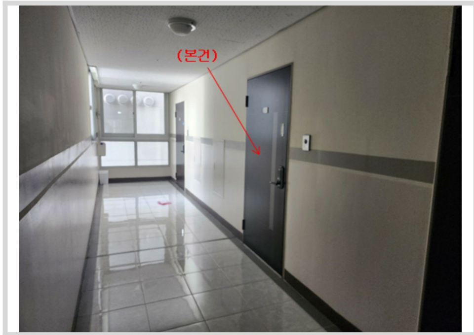
본건 현관문 전경