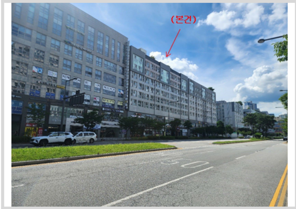
본건 주변 전경 - 본건 남동측 인근에서 촬영