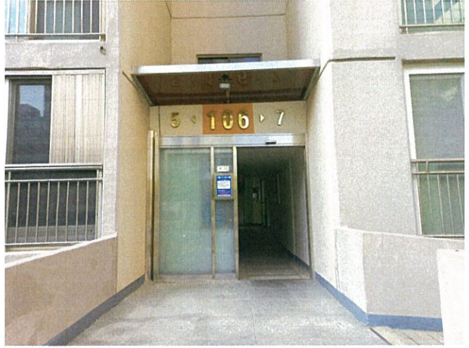
본건 1층 출입구