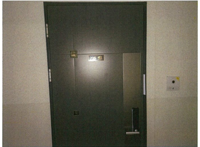
본건 현관 촬영