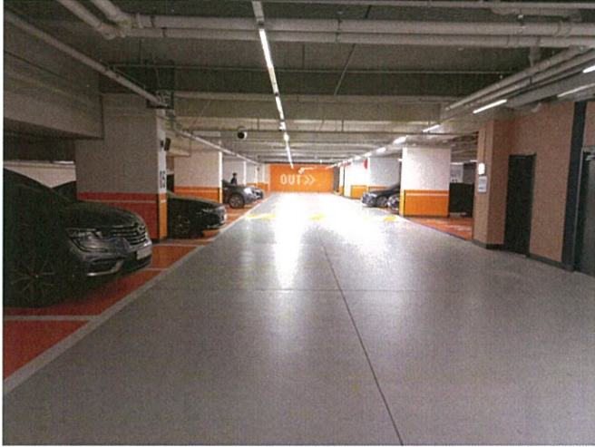
본건 지하 주차장 일부 촬영