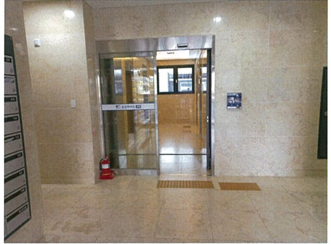
본건 1층 출입구 촬영