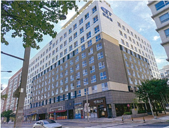
본건 북동측 전경