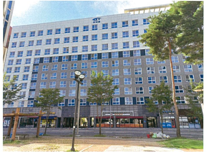
본건 동측에서 촬영