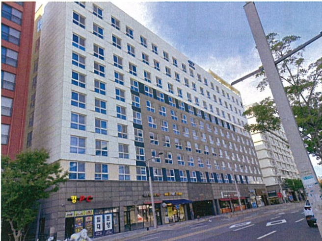
본건 남동측 전경