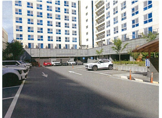
본건 서측 내부 지상 주차장 촬영