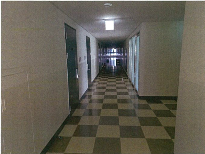
본건 복도 촬영