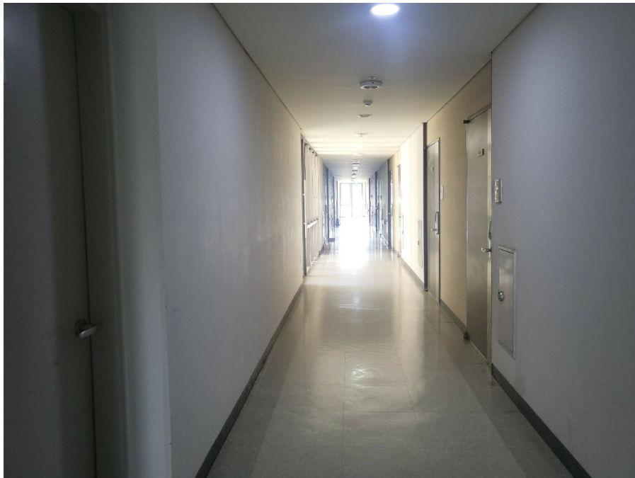
[ 9 ]