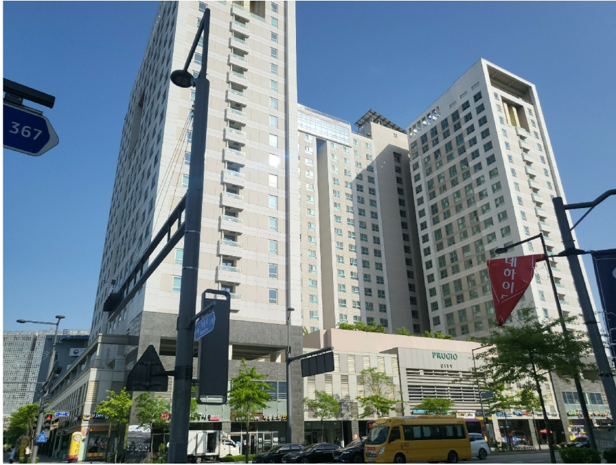
[ ( ) ]