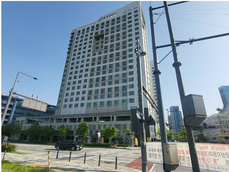
[ ( ) ]