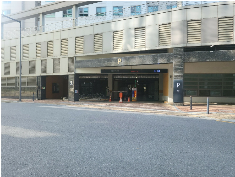
[ P ]