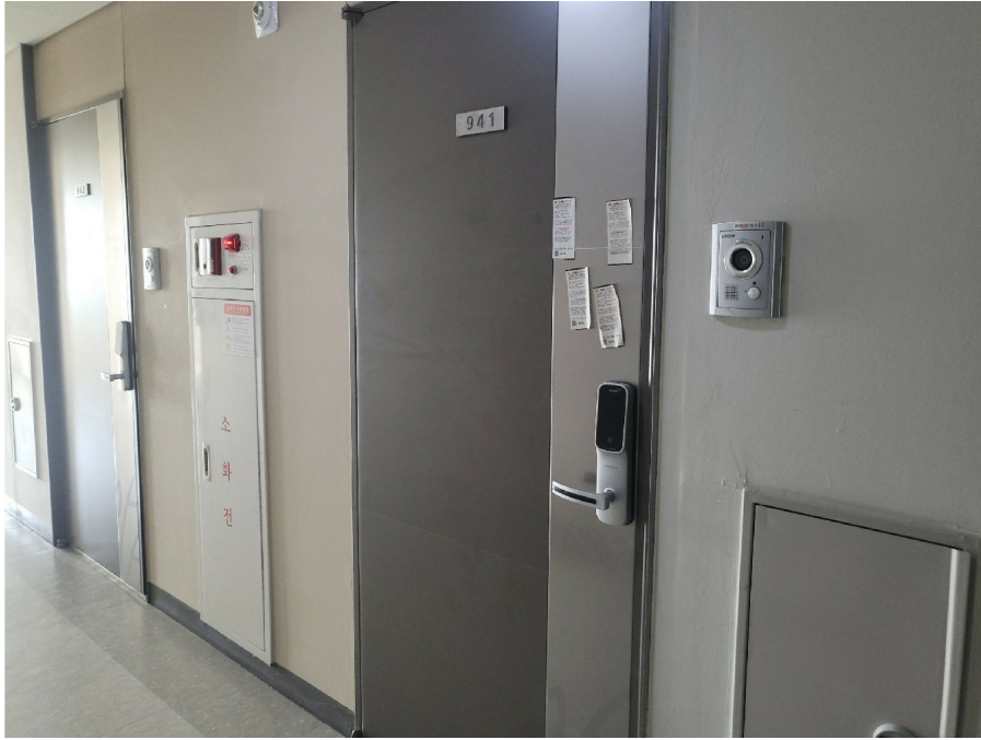
[ ( 9 941 ) ]