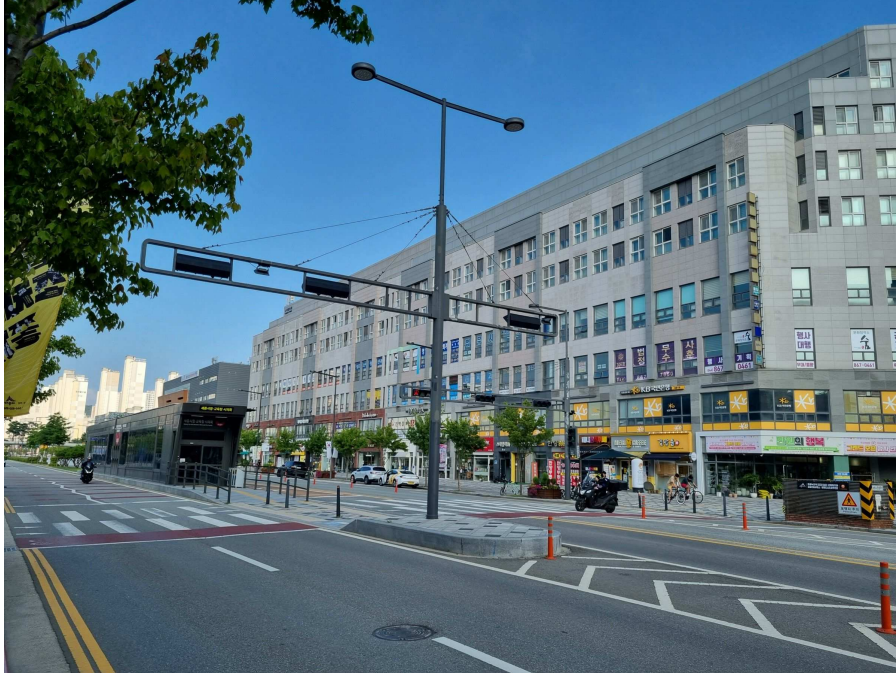
본건 및 주변환경