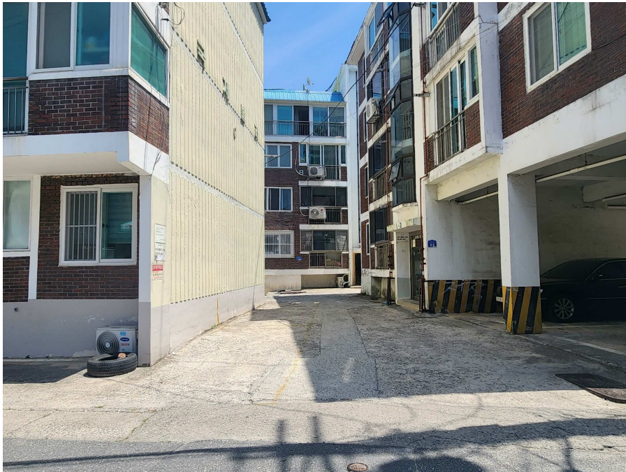
본건 건물전경 및 진입로 부분