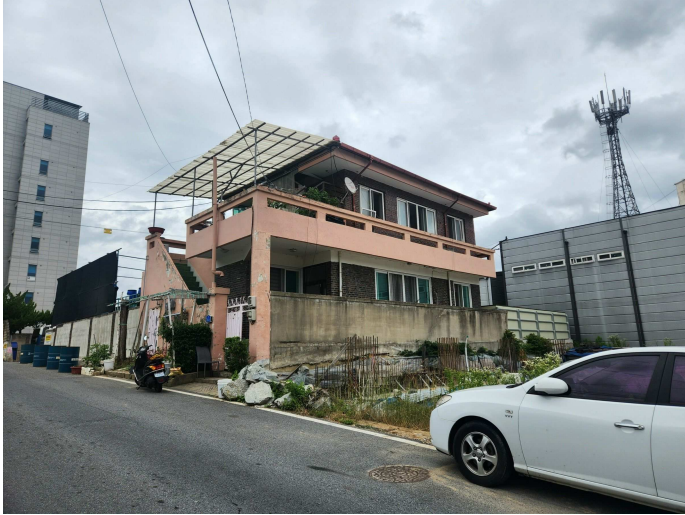
본건 건물전경(남서측에서 촬영)