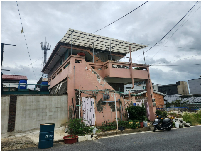
본건 건물전경(북서측에서 촬영)