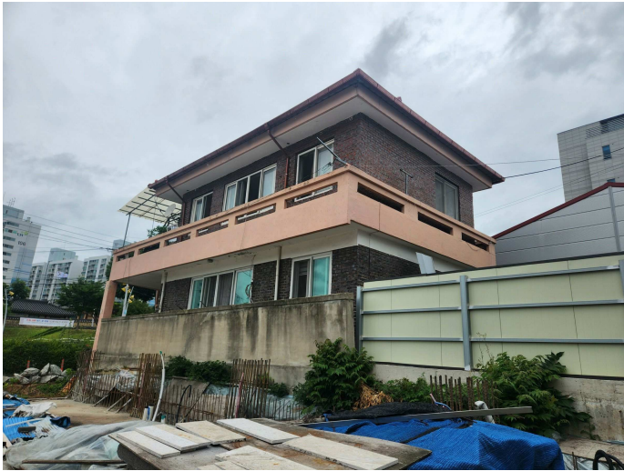
본건 건물전경(남동측에서 촬영)