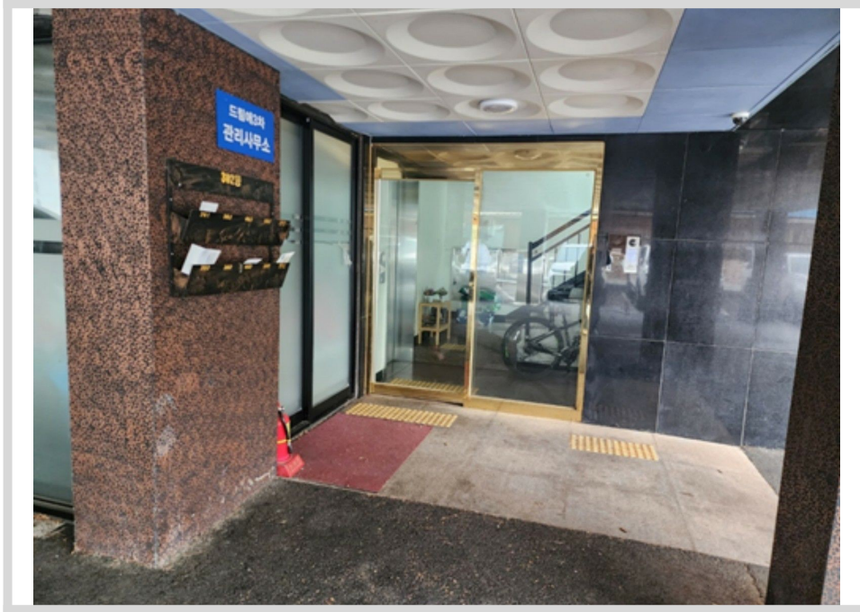
본건 1층 공동 출입문 전경