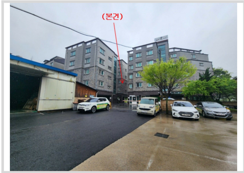
본건 주변 전경 - 본건 북동측에서 촬영