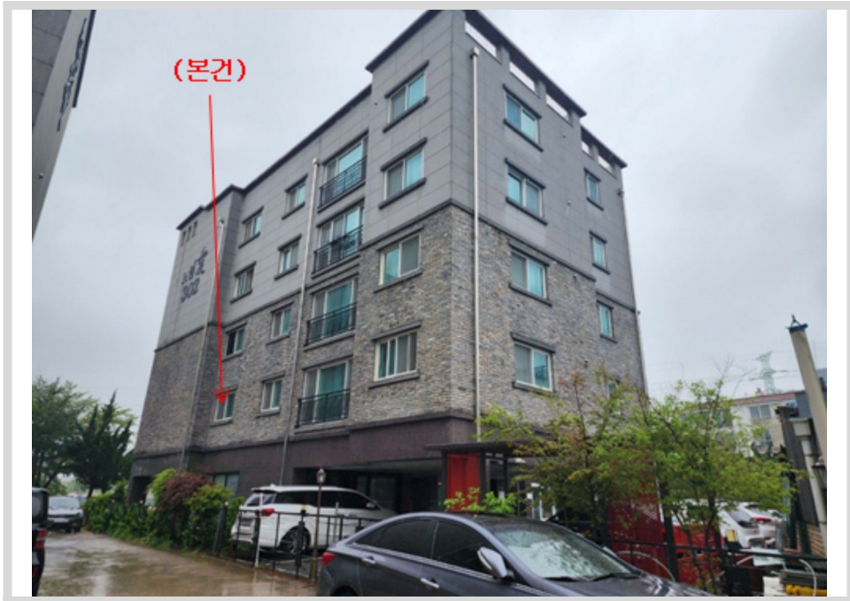
본건 전경 - 본건 동측에서 촬영