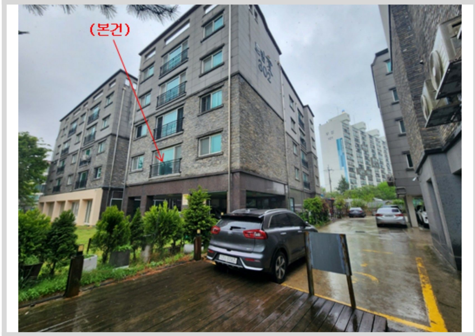
본건 전경 - 본건 서측에서 촬영