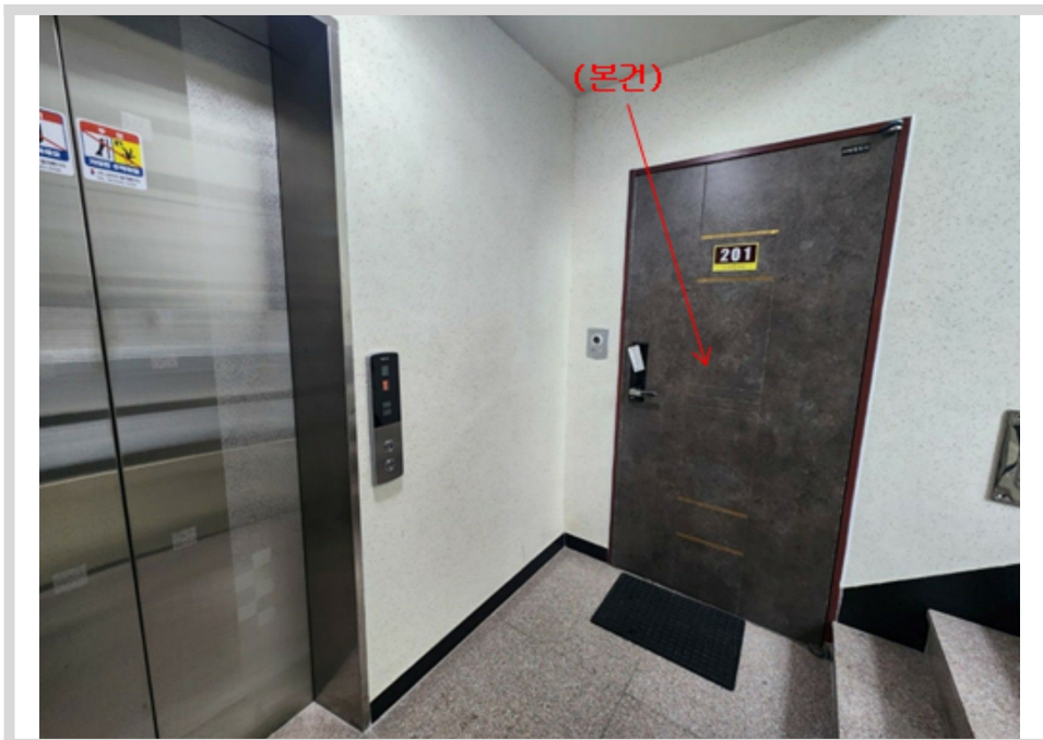
본건 현관문 전경