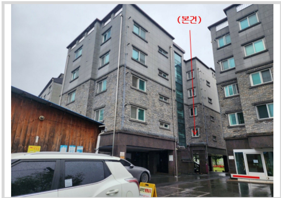
본건 전경 - 본건 북동측에서 촬영