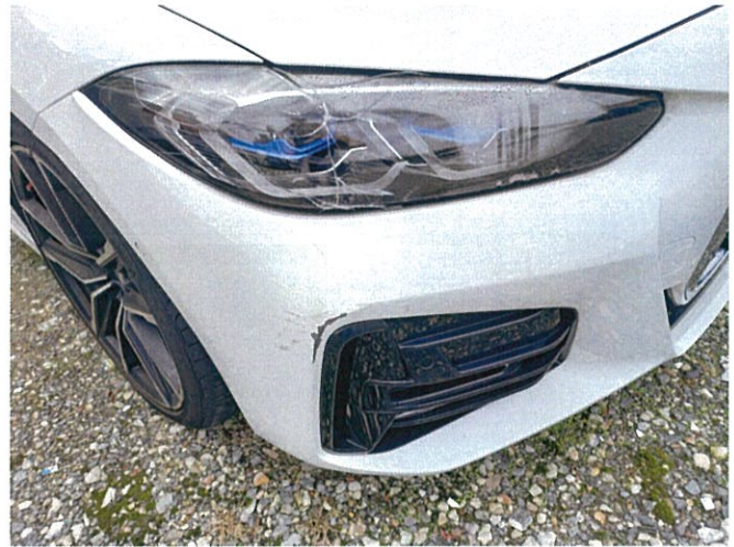
본건 사고 흔적