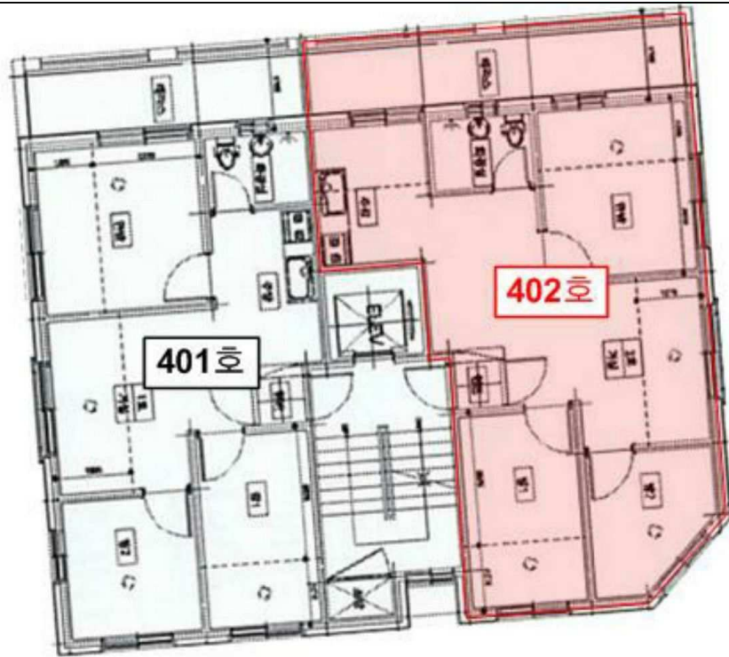
< 본건 제4층 호별배치도 >