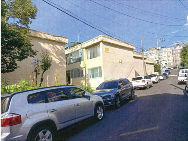
본건 단지 남측 촬영