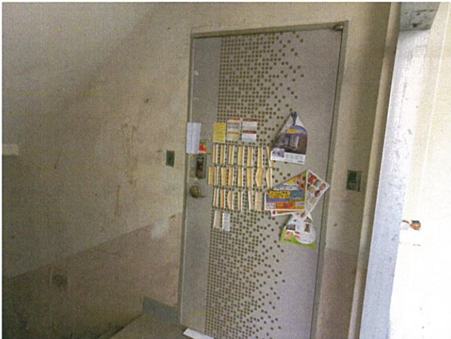
본건 현관 촬영