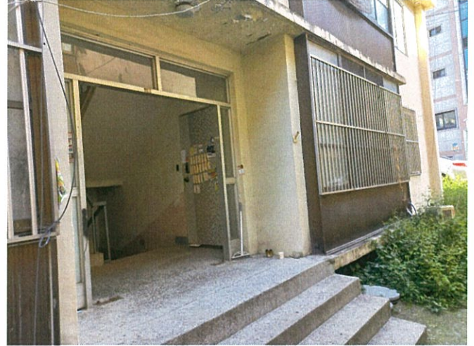
본건 출입구 및 전면 촬영