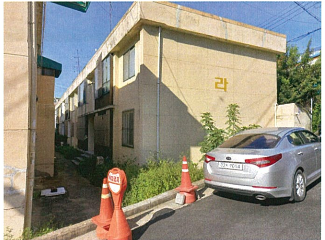
본건 남측에서 촬영