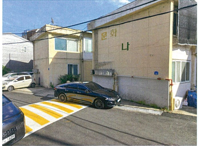
본건 단지 북측 촬영