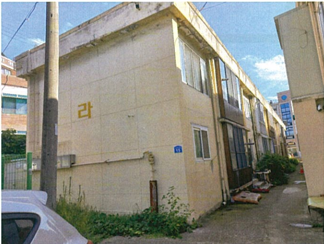
본건 북측에서 촬영