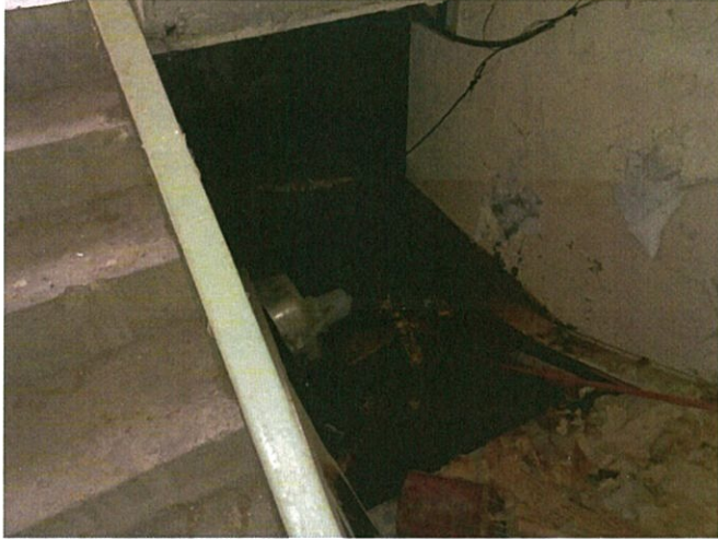
본건 공용 지하부분 촬영