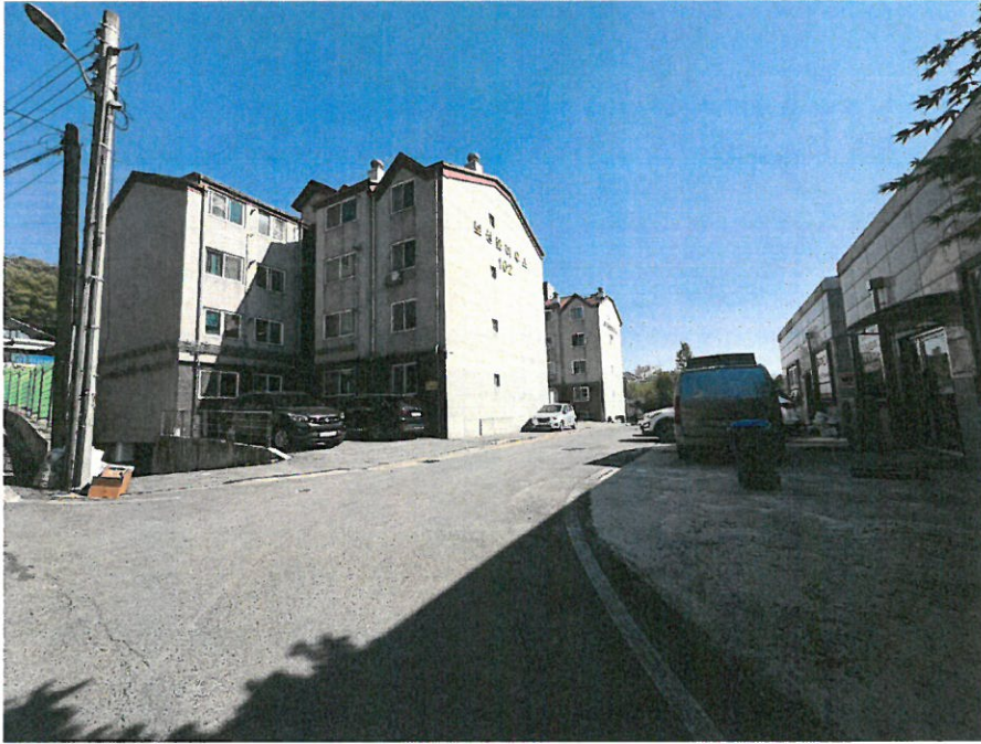
본건 전경 및 접면 도로