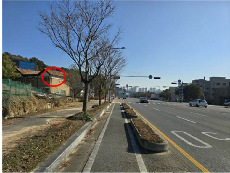
[주 위 환경]