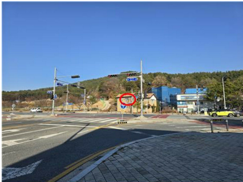
[주 위 환경]