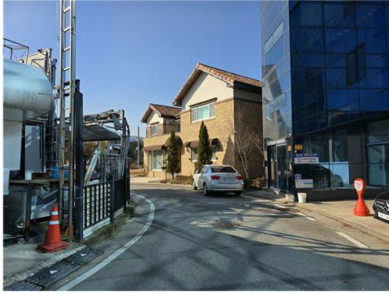
[본 건 모습]