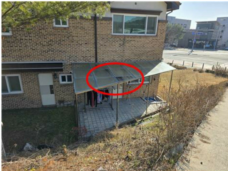
[제시외 건물 ㉠]