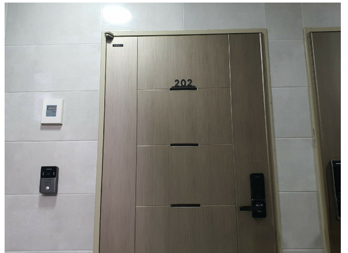
( 2 202 )